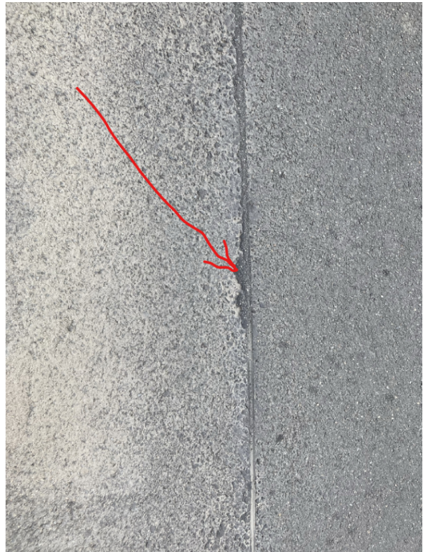
nesprávné/nepřijatelné provedení zálivky