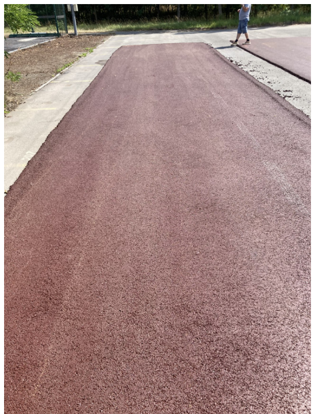
SMA – modifikovaný

Oba vzorky, jak ACO, tak i SMA, byly provedeny v přírodní, cihlově červené barevnosti. Oba vzorky jsou z hlediska barevnosti možné pro použití na chodnících Dvoreckého mostu.