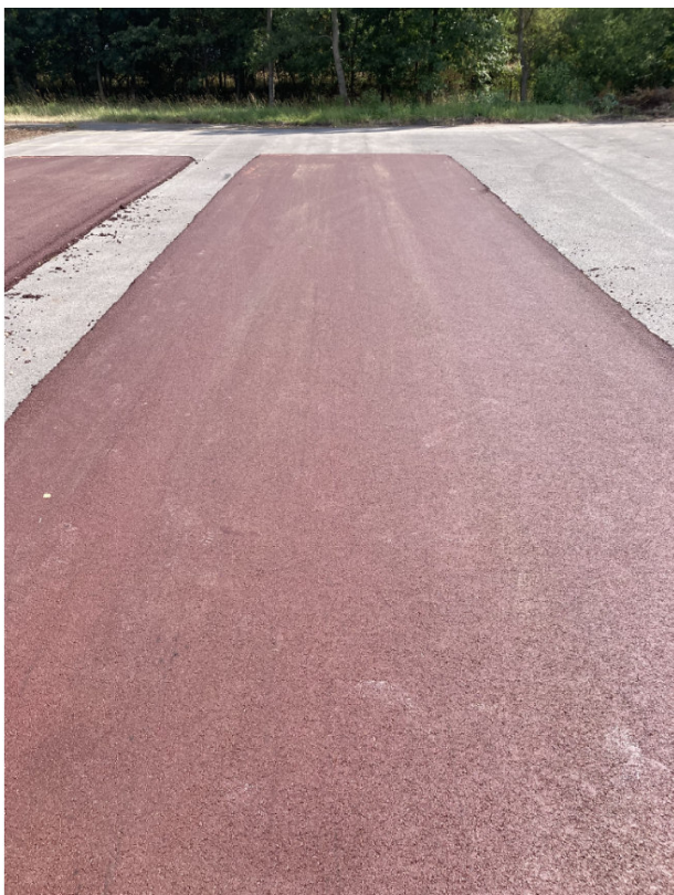
ACO – modifikovaný

Dne 15. 07. 2025 proběhla v prostorách obalovny v Horních Počernicích prohlídka vzorků asfaltových povrchů chodníků.