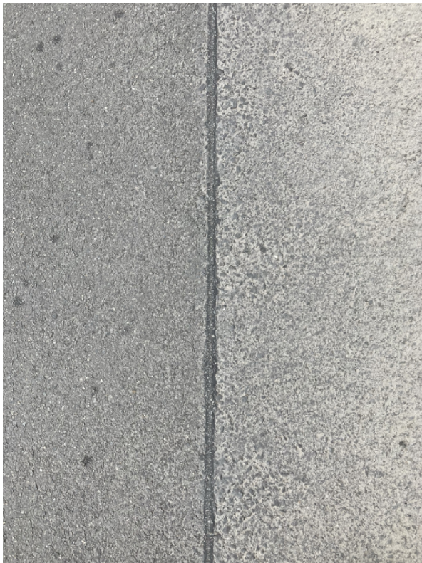
správné/přijatelné provedení zálivky

Asfaltovou zálivku mezi povrchem chodníku a zábradlím je přípustné provést v černé barvě, nicméně je nutné dbát na její kvalitní provedení. Černá linie mezi cihlově červeným povrchem chodníku a bílou slepeckou vodící linií zábradlí bude výrazně pohledově exponována a AD bude požadovat její provedení bez závad. Proto dopředu co možná nepodrobněji na uvedenou problematiku upozorňuje a definuje míru přijatelnosti provedení. Zálivka bude provedena jako tenká linie bez znatných rozšíření ať už v délce nebo bodově. Případné nepřesnosti, které při realizaci vzniknou je nutné odstraňovat průběžně při vlastním provádění!